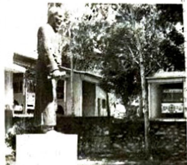
തിരുവനന്തപുരം ജനറൽ ഹോസ്പിറ്റൽ അംഗീകൃത സ്ഥാപിക്കാൻ കഴിഞ്ഞില്ല അർണോസ് പാതിരി പ്രതിമ തിരുവനന്തപുരം ലയോള കോളേജ് കാമ്പസിൽ.