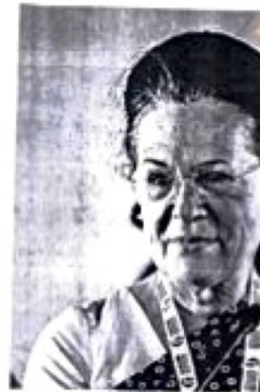
CONGRESS PRESIDENT Sonia Gandhi.

The Bal Manch will organise nationwide painting competitions during the Bharat Jodo Yatra (a 100-day, 2,500-km march from September 2) and hold an exhibition of the five best paintings from each State after the yatra is concluded. The theme of this competition will be "Unity in Diversity".